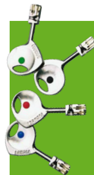
Cylindre 787 Z

Nos produits sont garantis 10 ans. Voir conditions auprès de votre Point Fort Fichet ou sur notre site www.fichet-pointfort.com